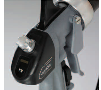
Bei der Cascade Pistole gehört das Einstellen des Spritzbildes an der Pistole und das Einstellen der Spannung mit drei Einstellwerten zur Grundausrüstung.

Halterungen für mehrere Befestigungspositionen sind optional erhältlich.