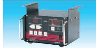
AA90 Cascade Steuergerät

An der Vector Cascade Spritzpistole kann der Anwender zwischen drei voreingestellten Spannungen auswählen. Mit dem Steuergerät auf Mikroprozessorbasis werden die Daten gespeichert. So kann das Verhältnis von Lackverbrauch und der Anzahl der lackierten Teile ermittelt werden.