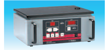
AA90 Classic Hochspannungserzeuger

Die beleuchtete LED-Anzeige am Steuergerät ermöglicht eine gute Ablesbarkeit.